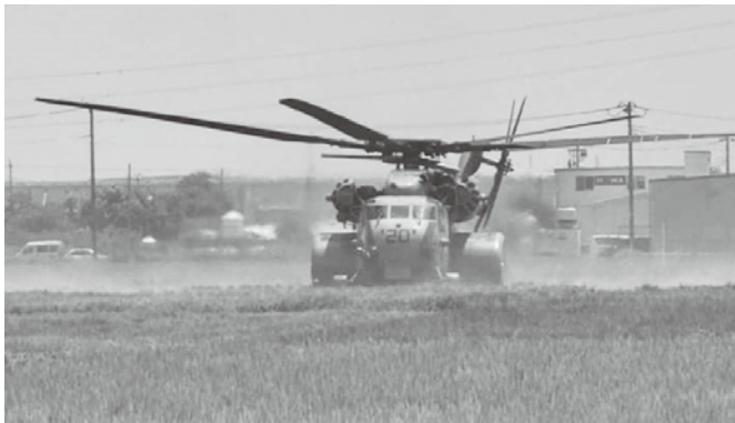
海老名市の水田に不時着した米軍ヘリ 奥に社家小学校が見える

8月3日朝から、海老名市では戦没者慰霊祭が行われ、私は献花を終え、不戦の誓いを胸に、自宅へと戻りました。そこへ、社家4丁目米軍のヘリが不時着したらしいと一報が入り、私は現場に駆け付けました。現場では水田の稲の上に大きな軍用ヘリがプロペラを回しっぱなし。とても熱いのでしよう。陽炎のようなものが立ち上っていました。米軍のヘリはその後、不時着後1時間半ぐらいたって、大谷の住宅街の方に黒っぽい煙を吐きながら、厚木基地へ向けて自力で飛び立っていきました。