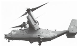
オスプレイは欠陥機騒音と墜落の危険が高まる可能性があります。オスプレイの交代配備には反対の声を上げて行きます。

さらすのは、あまりにも理不尽です。厚木爆同では本年3月、事故原因の究明ぬきでの飛行再開に対して抗議申し入れを行いました。さらに全国の仲間と力を合わせて、危険極まりないオスプレイの飛行を止めましょう。欠陥機と言われているオスプレイは、点検のための飛行停止からわずか3ヶ月程で不具合の原因も公表しないで飛行の再開を実施しました。空母交代によりオスプレイが連絡機になりますと厚木基地への飛来も多くなり、機騒音と墜落の危険が高まる可能性があります。オスプレイの交代配備には反対の声を上げて行きます。