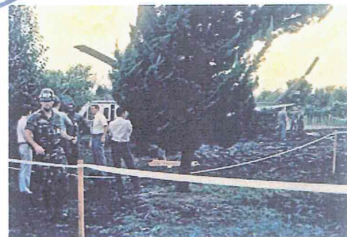
1989年大和市下鶴間でUH-1が緊急着陸。 負傷者はいなかったものの、すぐ近くには 中学校・高校がある。