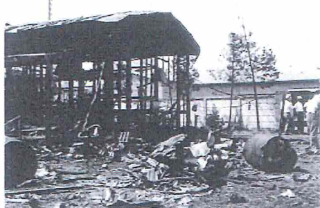
1964年大和市上草柳でF-8Cが墜落。 住民5人が死亡するという大惨事となった。