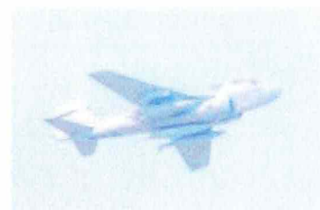
事故原因等の公表もないまま大 和市上空を飛行する事故機 EA-6B プラウラー