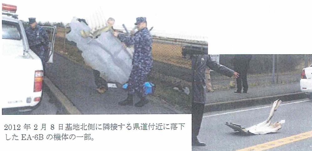
2012年2月8日基地北側に隣接する県道付近に落下したEA-6Bの機体の一部。